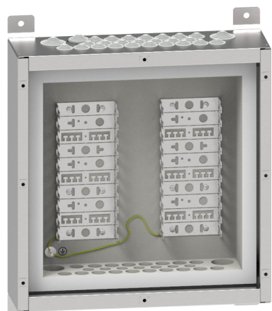
Abb. 1: Brandschutzgehäuse BSG30D mit Montagewanne BR2

Das Gehäuse bietet einen besonders sicheren Betrieb und optimaler Schutz des Gehäuseinneren vor Staub und Feuchtigkeit durch integrierte Stufennippel (Abb. 2) mit Dichtlippen mit Schutzart IP 55 an den Kabeleinführungen.