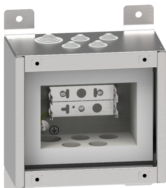
Abb. 1: Brandschutzgehäuse BSG30A mit Montagewanne BR2

Das Gehäuse bietet einen besonders sicheren Betrieb und optimaler Schutz des Gehäuseinneren vor Staub und Feuchtigkeit durch integrierte Stufennippel (Abb. 3) mit Dichtlippen mit Schutzart IP 55 an den Kabeleinführungen.