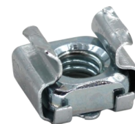
Abb. 3: Automatische Erdung des Deckels über Erdungskäfigmutter